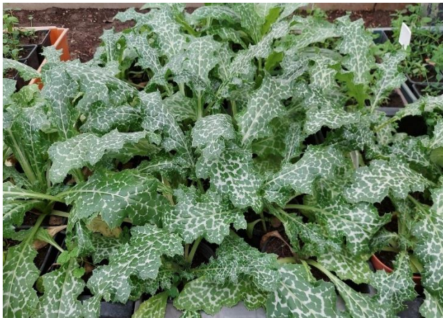
Młode rozety liściowe

Ziele ostropestu jest cennym źródłem aktywnych związków fenolowych, głównie kwasów fenolowych (kwas chlorogenowy, kwas neochlorogenowy, kwas kawowy) oraz flawonoidów (rutozyd kwercetyny, glukozyd, galaktozyd, ramnozyd kwercetyny) [Ożarowski i wsp., 2024 DC].