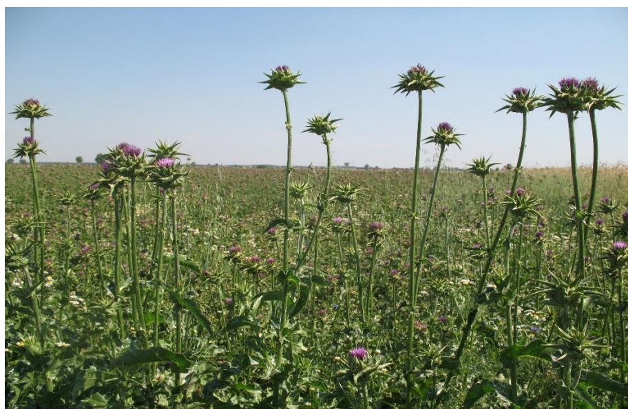
Plantacja surowcowa ostropestu